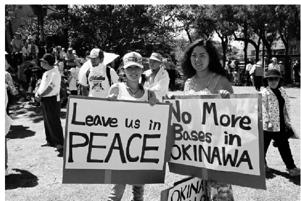
ヘリ墜落に抗議する市民。(沖縄県・宜野湾市)