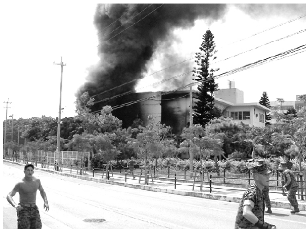
普天間基地のヘリコプターが沖縄国際大学に墜落。(04年)

米海兵隊は現在、3つの海兵遠征軍を保有しています。このうち海外配備は、沖縄駐留の第3海兵隊遠征軍だけです。