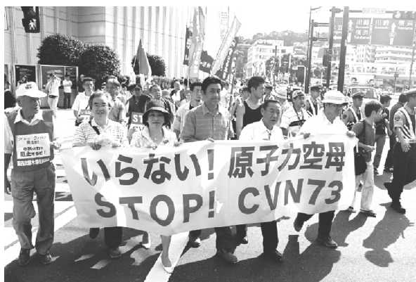
原子力空母の母港化に反対。(神奈川県・横須賀市)