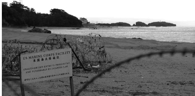
辺野古の米軍基地エリア

さらに沖縄県では11月に県知事選挙が行われます。この選挙で基地建設反対の候補者が当選すれば、埋め立て許可の可能性は完全に無くなるのです。