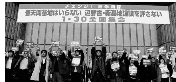
全国から6000人が参加した反対集会。沖縄からも100人が上京して、「基地建設反対」の声をあげた。

沖縄県の世論が、新基地建設反対であることは明かです。建設推進は、自民党政権時代よりも、困難になっているのです。