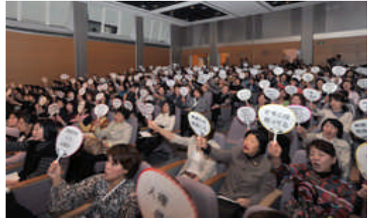
【全国オモニ会連絡会主催の緊急集会＝3月16日、東京】

『韓国併合』から 100 年 真の和解・平和・友好を求める 2010 年運動(韓統連、日韓民衆連帯全国ネットワーク、「戦争と女性への暴力」日本ネットワークなど 6 団体で構成)、首相、文科大臣宛に要請書提出。