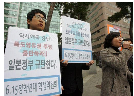
【6.15 南側青年学生本部による抗議＝4 月 1 日、日本大使館前(ソウル)】