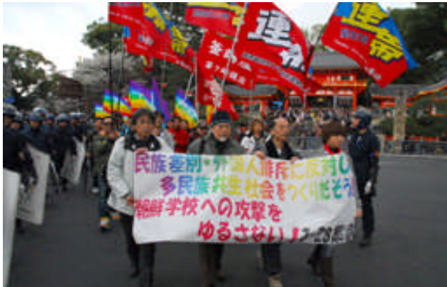
【「朝鮮学校を支援する京滋」など主催の集会＝3 月 28 日】

「日朝友好兵庫県民の会」など 25 団体共催の緊急集会 (500 名参加)。 「福岡県日朝友好協会」など 13 団体共催の緊急集会 (220 名参加)。 韓国挺身隊問題対策協議会声明。