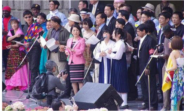
【「第 81 回日比谷メーデー」で合唱に参加し、差別なき「無償化」適用をうったえる朝鮮高校生徒＝5 月 1 日、東京】

兵庫県大倉山で行われた「第 81 回メーデー」に西神戸朝鮮初級学校の子どもたちが友情出演。