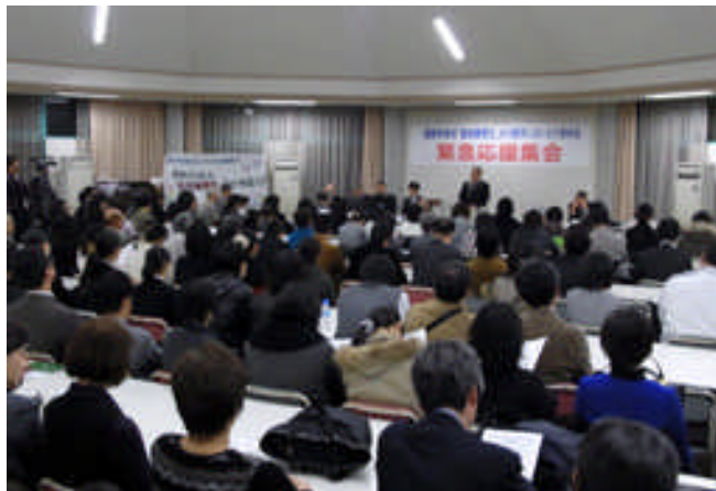
【朝鮮学校を「高校無償化」の対象から除外しないことを求め、日朝友好促進東京議員連絡会、東京平和運動センター、東京ーピョンヤン友好交流会議が主催した緊急応援集会＝3月12日、東京】