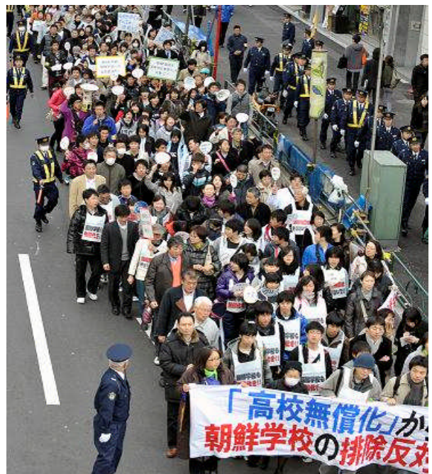
【「高校無償化」からの朝鮮学校生徒排除に反対する緊急行動。日本の市民と在日朝鮮人約 1,000 人がデモ行進＝3月27日、渋谷】