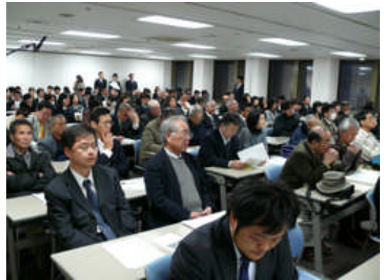
【「朝鮮学校も高校無償化を！」福岡緊急集会＝3 月 29 日】

3月30日 大阪オモニ会主催緊急集会 (300 名参加)。 宇治市議会は「授業料無償化制度から 朝鮮学校を除外しないことを求める意見書」 可決。