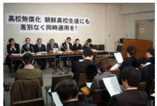
【「高校無償化」同時適用を訴え記者会見に臨む朝鮮学校関係者たち＝4 月 1 日、参議院会館】