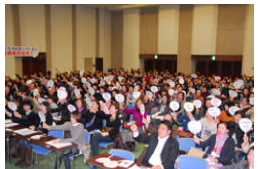
【朝鮮学校への「無償化」適用を訴える集会に参加するオモニ(母親)たち＝3 月 30 日、大阪】

4月 5日 栃木朝鮮初中級学校の学父母代表ら 7 名が、 谷博之民主党栃木県連代表に首相、文科相 あての要請文を提出。 「フォーラム平和・人権・環境」声明。 市民団体メンバー 5 名が、牧野聖修民主党静岡 県連会長に朝鮮学校への高校無償化法の適用 を求める申し入れ。 村井嘉浩宮城県知事、文科省が朝鮮学校への 無償化適用の判断を都道府県に委ねる方向で 検討を始めたことについて「非常に無責任だ」。